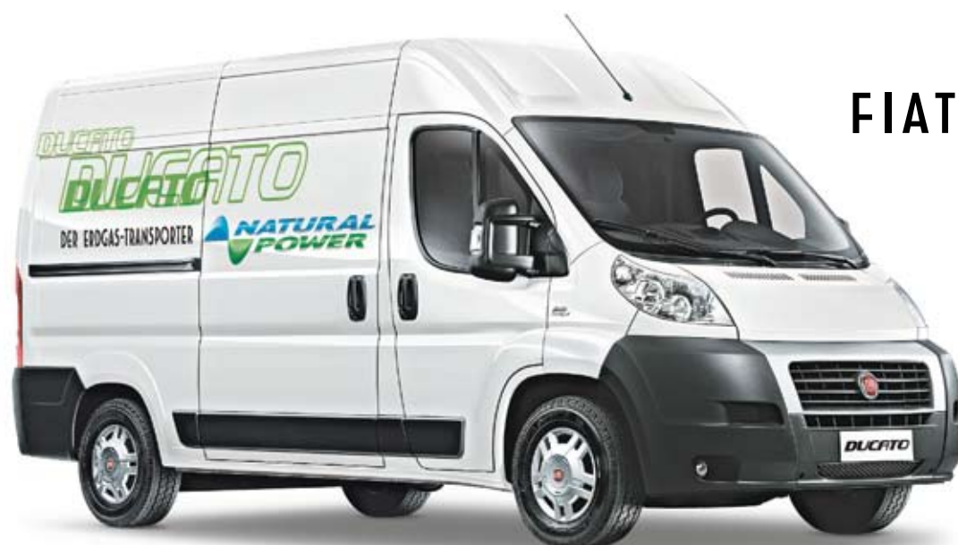
06/09 Abb. enthält Sonderausstattung.