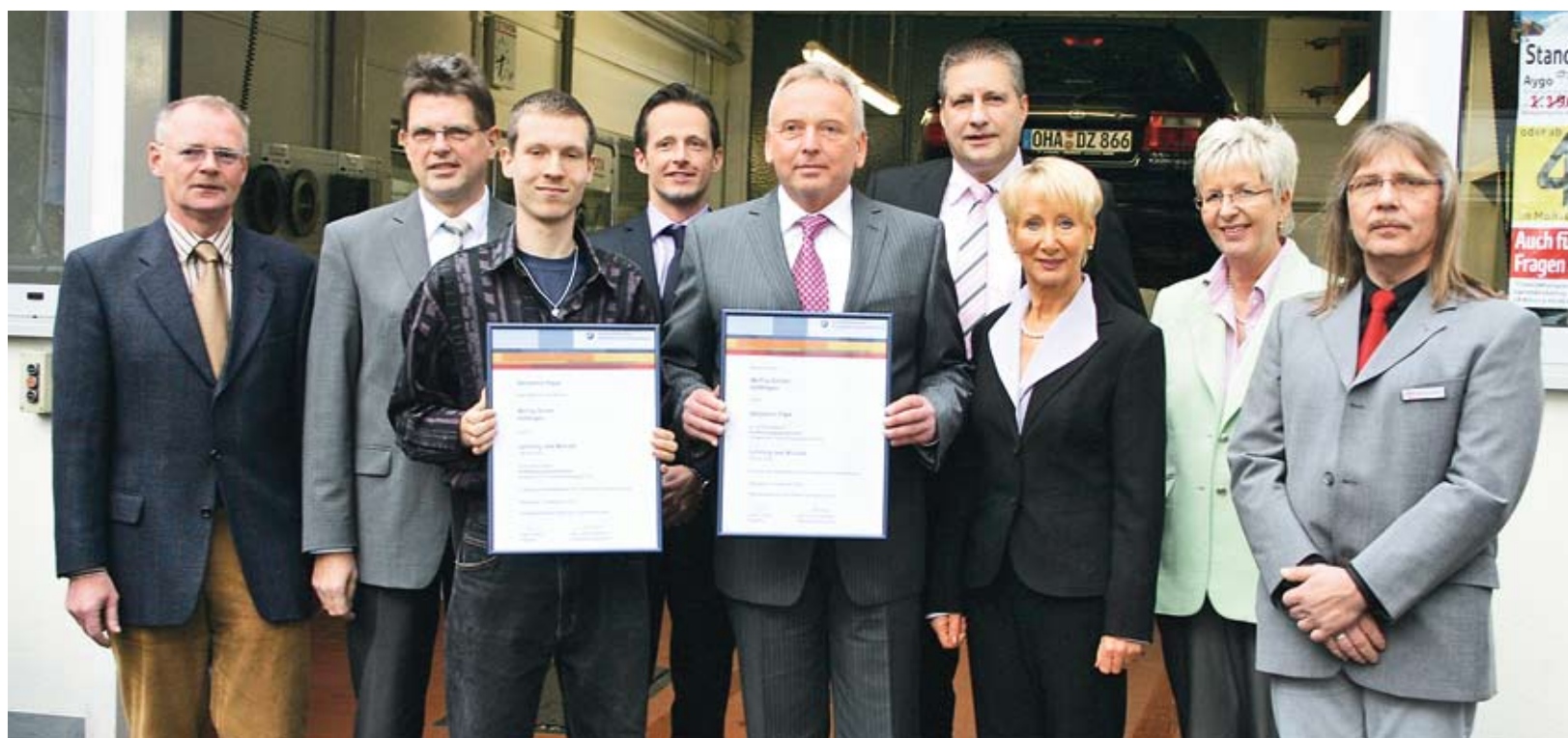
Im Mittelpunkt: Betrieb, Handwerkskammer und Kreishandwerkerschaft gratulierten.